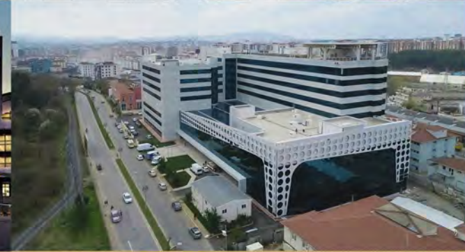
ÇEKMEKÖY DEVLET HASTANESİ