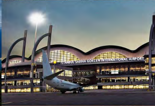
SABIHA GÖKÇEN HAVAALANI